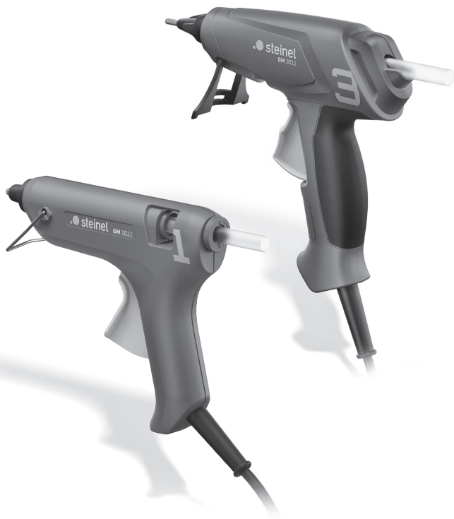
GlueMatic 1011 GlueMatic 3011